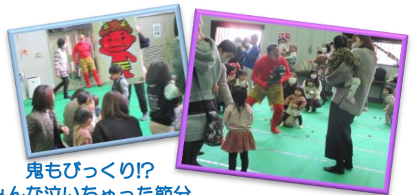
鬼もびっくり! みんな泣いちゃった節分