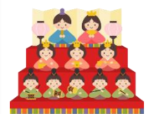
男の子も女の子も みんなで楽しんだひなまつり