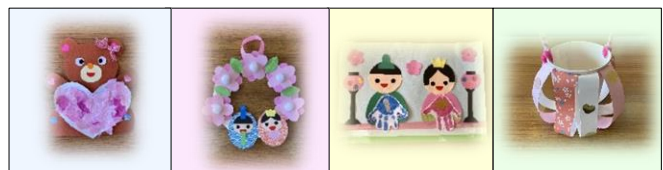
「バレンタイン」「おひなさま」「おひなさま」「ひなあられ入れ」 (手形)