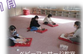
ベビーマッサージ教室